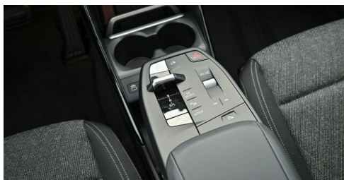
Bierbaum GmbH - Sooß - www.bmw-bierbaum.at