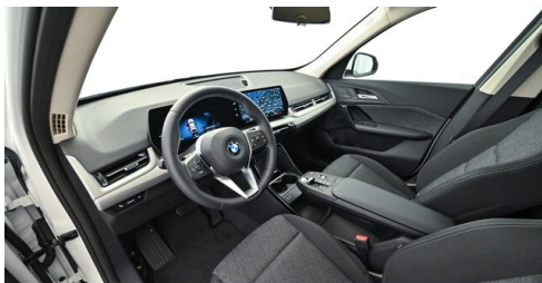
Bierbaum GmbH - Sooß - www.bmw-bierbaum.at