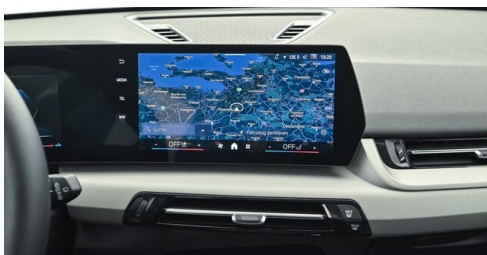
Bierbaum GmbH - Sooß - www.bmw-bierbaum.at