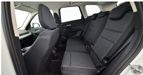
Bierbaum GmbH - Sooß - www.bmw-bierbaum.at