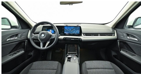
Bierbaum GmbH - Sooß - www.bmw-bierbaum.at