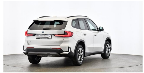
Bierbaum GmbH - Sooß - www.bmw-bierbaum.at