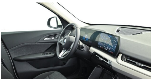
Bierbaum GmbH - Sooß - www.bmw-bierbaum.at