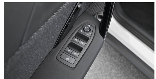
Bierbaum GmbH - Sooß - www.bmw-bierbaum.at