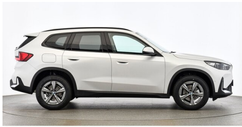
Bierbaum GmbH - Sooß - www.bmw-bierbaum.at