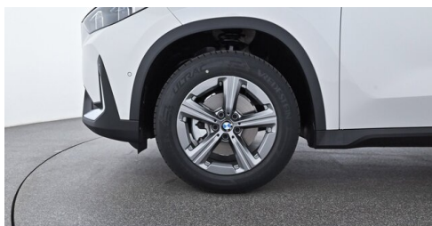
Bierbaum GmbH - Sooß - www.bmw-bierbaum.at