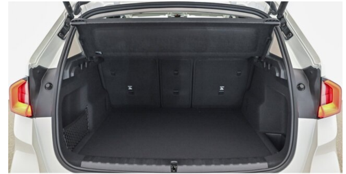
Bierbaum GmbH - Sooß - www.bmw-bierbaum.at