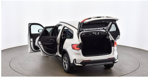
Bierbaum GmbH - Sooß - www.bmw-bierbaum.at