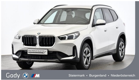
Gady Steiermark • Burgenland • Niederösterreich