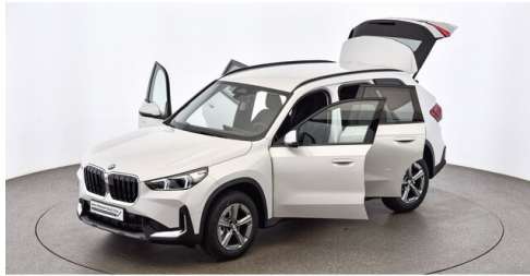
Bierbaum GmbH - Sooß - www.bmw-bierbaum.at