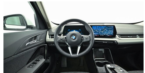
Bierbaum GmbH - Sooß - www.bmw-bierbaum.at