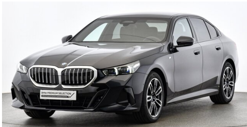
Höglinger Denzel GesmbH - Linz - www.bmw-hoeglinger.at