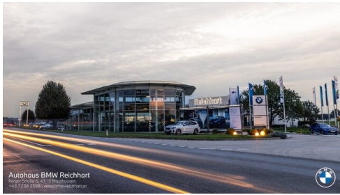
Autohaus BMW Reichhart Perger Straße 6, 3111 Mauthausen +43 72 38 2588 | www.bmw-reichhart.at