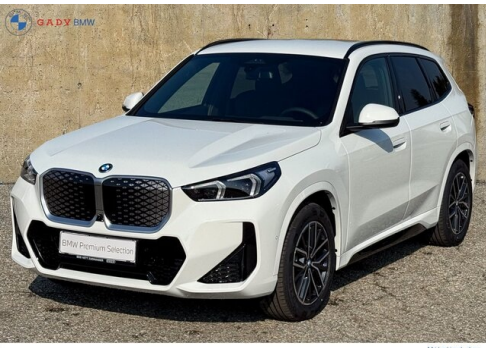
Mixto de 8 GADY Family