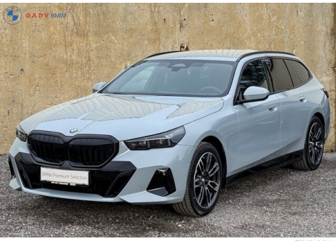
Mitglieds der GADY Family