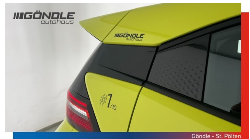
Göndle - St. Pölten