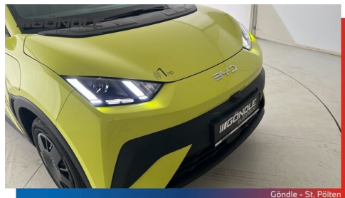
Göndle - St. Pölten