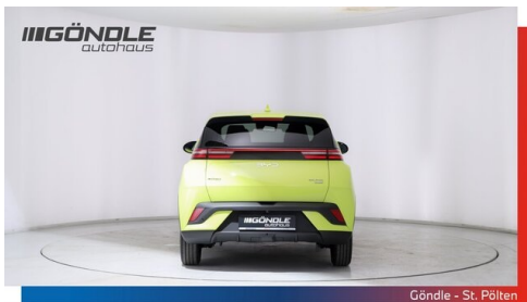
Göndle - St. Pölten