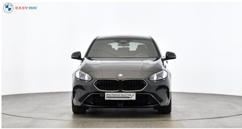
Milieu de GADY Family