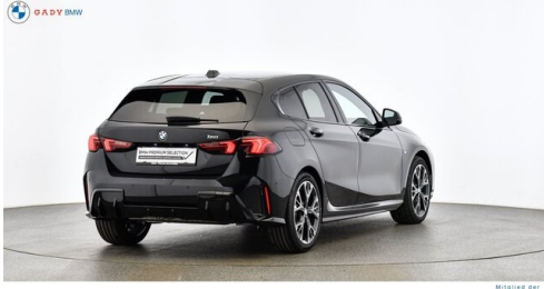
Milieu de GADY Family