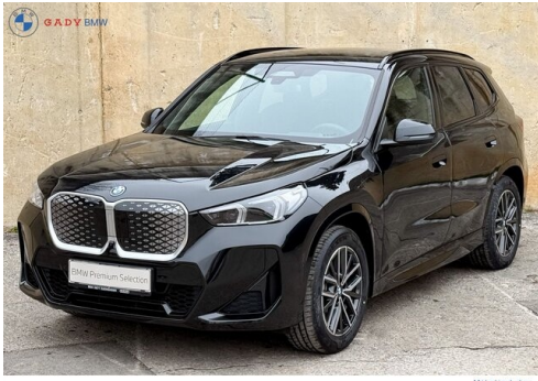
Mitglieds der GADY Family