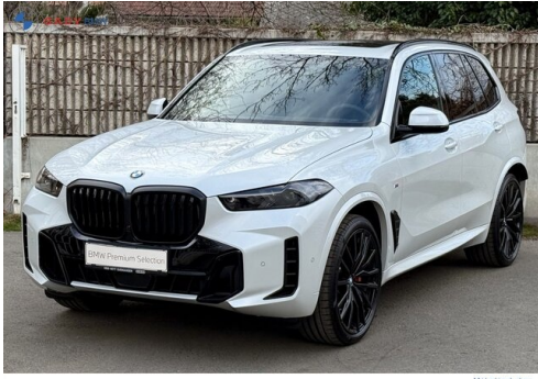
Mitglied der GADV Family