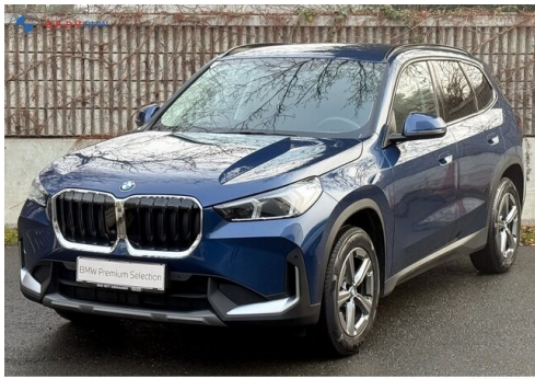
Mitglied der GADV Family