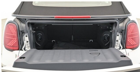
Autohaus Innerbichler GmbH - Ramsau im Zillertal - www.innerbichler.bmw.at