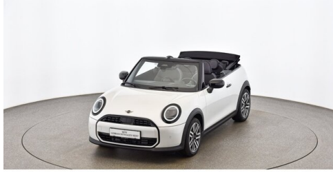
Autohaus Innerbichler GmbH - Ramsau im Zillertal - www.innerbichler.bmw.at