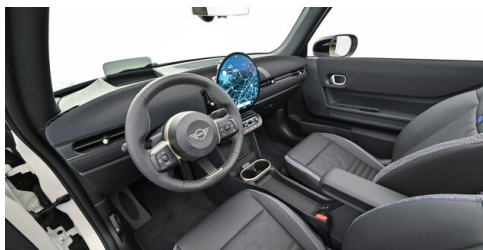
Autohaus Innerbichler GmbH - Ramsau im Zillertal - www.innerbichler.bmw.at