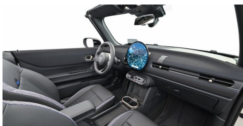
Autohaus Innerbichler GmbH - Ramsau im Zillertal - www.innerbichler.bmw.at