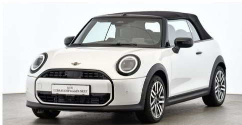
Autohaus Innerbichler GmbH - Ramsau im Zillertal - www.innerbichler.bmw.at