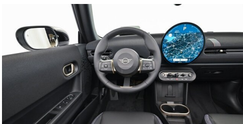
Autohaus Innerbichler GmbH - Ramsau im Zillertal - www.innerbichler.bmw.at