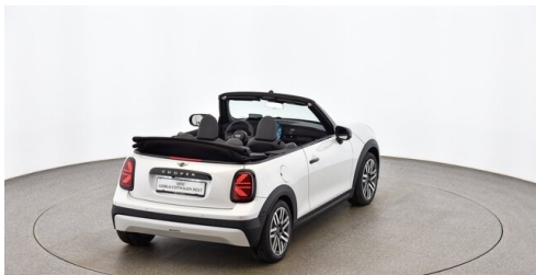
Autohaus Innerbichler GmbH - Ramsau im Zillertal - www.innerbichler.bmw.at