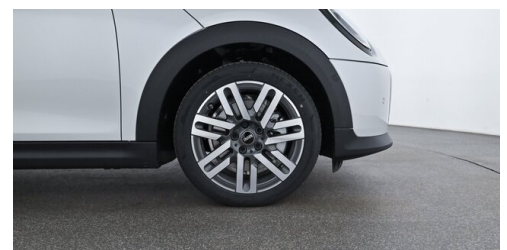
Autohaus Innerbichler GmbH - Ramsau im Zillertal - www.innerbichler.bmw.at

(1) Die angegebenen Werte über Kraftstoffverbrauch und CO 2 -Emissionen wurden nach den vorgeschriebenen Messverfahren gem. VO (EG) 715/2007 ermittelt. Als Basis für die Verbrauchsermittlung gilt der ECE-Fahrzyklus (NEFZ). Dieser setzt sich aus ca. einem Drittel Fahrt innerorts und zwei Drittel außerorts (gemessen an der Wegstrecke) zusammen. Zusätzlich zum Verbrauch wird die CO 2 -Emission gemessen.