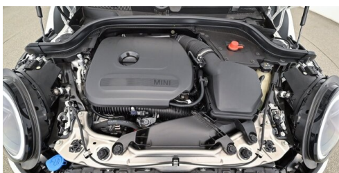
Autohaus Innerbichler GmbH - Ramsau im Zillertal - www.innerbichler.bmw.at