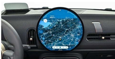
Autohaus Innerbichler GmbH - Ramsau im Zillertal - www.innerbichler.bmw.at