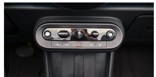
Autohaus Innerbichler GmbH - Ramsau im Zillertal - www.innerbichler.bmw.at