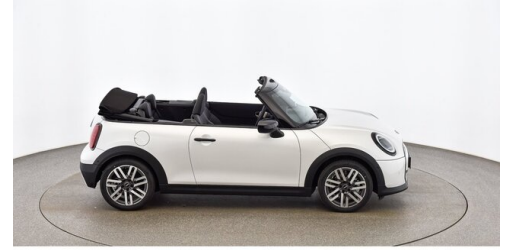
Autohaus Innerbichler GmbH - Ramsau im Zillertal - www.innerbichler.bmw.at