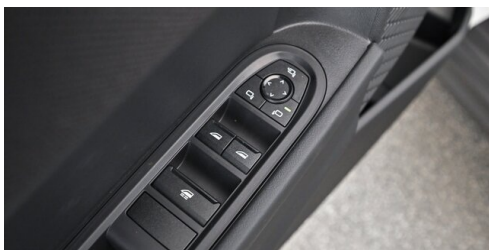
Autohaus Innerbichler GmbH - Ramsau im Zillertal - www.innerbichler.bmw.at