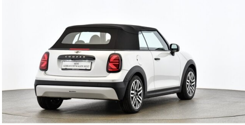
Autohaus Innerbichler GmbH - Ramsau im Zillertal - www.innerbichler.bmw.at