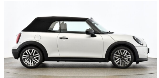
Autohaus Innerbichler GmbH - Ramsau im Zillertal - www.innerbichler.bmw.at