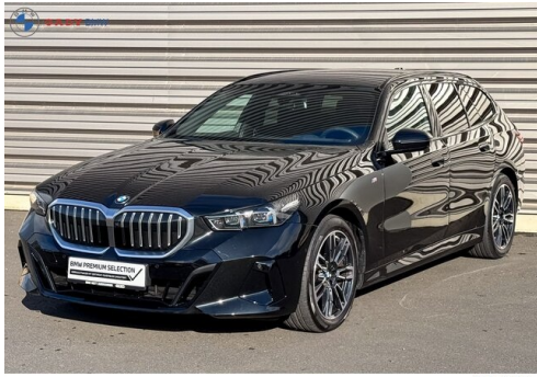
Модель: BMW 3 Series Touring Год выпуска: 2023