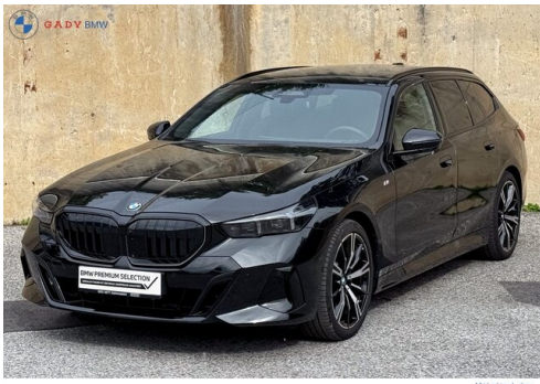
Migros car GADY Family