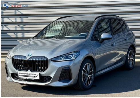
Migliore del G A D V Family