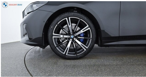
Migliore del GADY Family