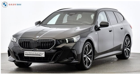
Migliore del GADY Family