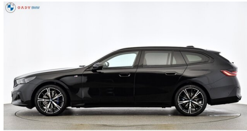
Migliore del GADY Family