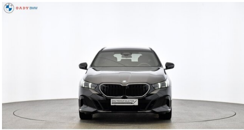
Migliore del GADY Family