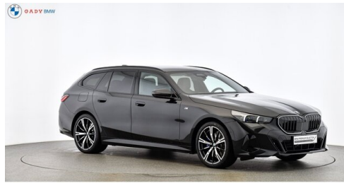
Migliore del GADY Family