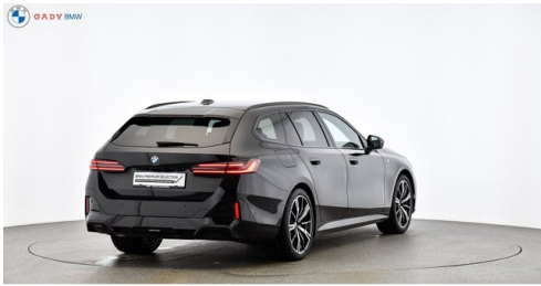
Migliore del GADY Family