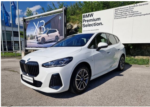
Zorn-Wolf GmbH - Imst - www.zorn-wolf.bmw.at 05412 / 63518