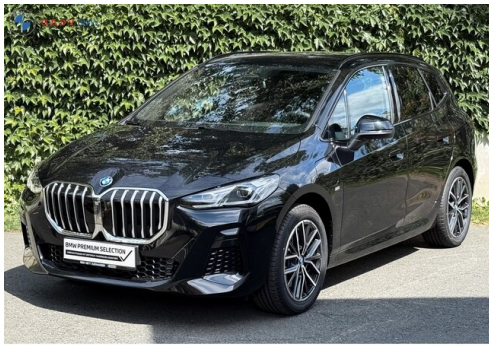
Mitglieds der GADV Family