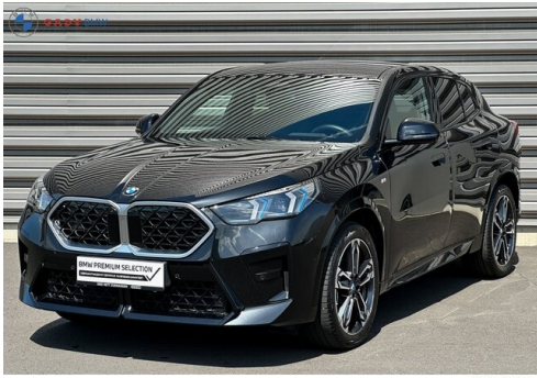
MiG 1105 car G A D V Family