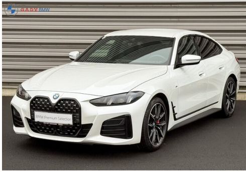
Mitglied der GADV Family